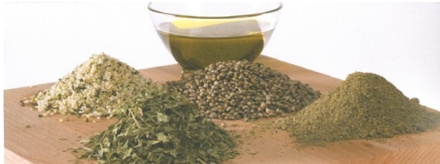
Foto: Fraktioner af hamp: Frø (midten), afskallede frøkim (tv), presset olie, proteinpulver fra proteinkagen (th) samt hampeblade til the (foran).

Hampeoliens meget høje indhold af omega 3, 6 og 9 fedtsyrer gør olien nærmest perfekt til humanernæring pga. forholdet mellem omega 3 og omega 6, hvor fedtsyrerne er meget afbalanceret, se tabel 1.