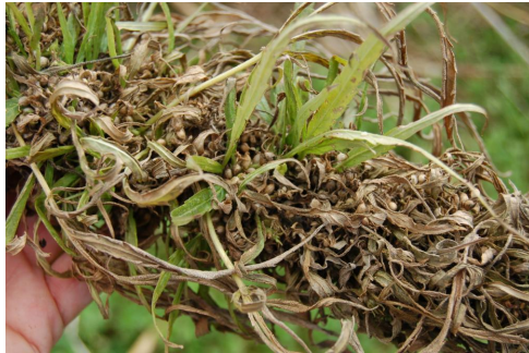
Hampefrø klar til høst.

Interessen for hampefrø skyldes hampefrøenes og -kagens høje indhold af aminosyrerne methionin, cystin, threonin m.fl. Hampefrø udgør dermed en potentiel højværdiproteinkilde for især svin og fjerkræ. Dertil kommer at hampeolien indeholder høje andele af højværdifedtsyrer som omega 3 og 6 m.fl., som gør olien interessant til human ernæring. Den fornyede interesse for hamp i Danmark skyldes ikke mindst jagten på økologisk protein, i forbindelse med udfasning af konventionel protein i den økologiske husdyrproduktion. Trods en stor interesse for hamp har kun få avlere dyrket hamp til modenhed, og årsagen er ikke mindst usikkerhed mht. modning af hampefrøet samt valg af høstteknik til bjærgning af modne frø. I udlandet dyrkes ca. 50.000 ton hampefrø på årsbasis (2008). Hoveparten dyrkes i Canada og EU (ca. 20.000 tons). I EU er det Frankrig og Tyskland, der er de største producenter af hampefrø.